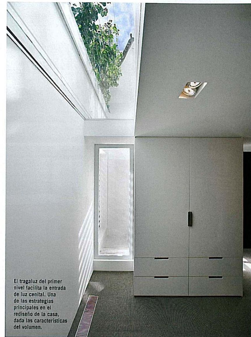
El tragaluz del primer nivel facilita la entrada de luz cenital. Una de las estrategias principales en el rediseño de la casa, dada las características del volumen.

“REVISAMOS MUCHAS ALTERNATIVAS DE DISEÑO PARA UNA MEWS HOUSE , PERO SIEMPRE VOLVEMOS A LA IDEA ORIGINAL, GIRANDO ALREDEDOR DE LA ESCALERA DE CIRCULACIÓN Y BUSCANDO LA MEJOR SOLUCIÓN PARA CONSEGUIR LUZ ”.