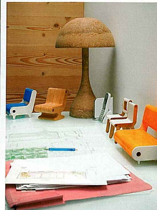
Detalle del escritorio con sillas miniaturas.

una mews house , pero siempre volvemos a la idea original, girando alrededor de la escalera de circulación y buscando la mejor solución para conseguir luz dentro y a través de los espacios”, dice Martin.