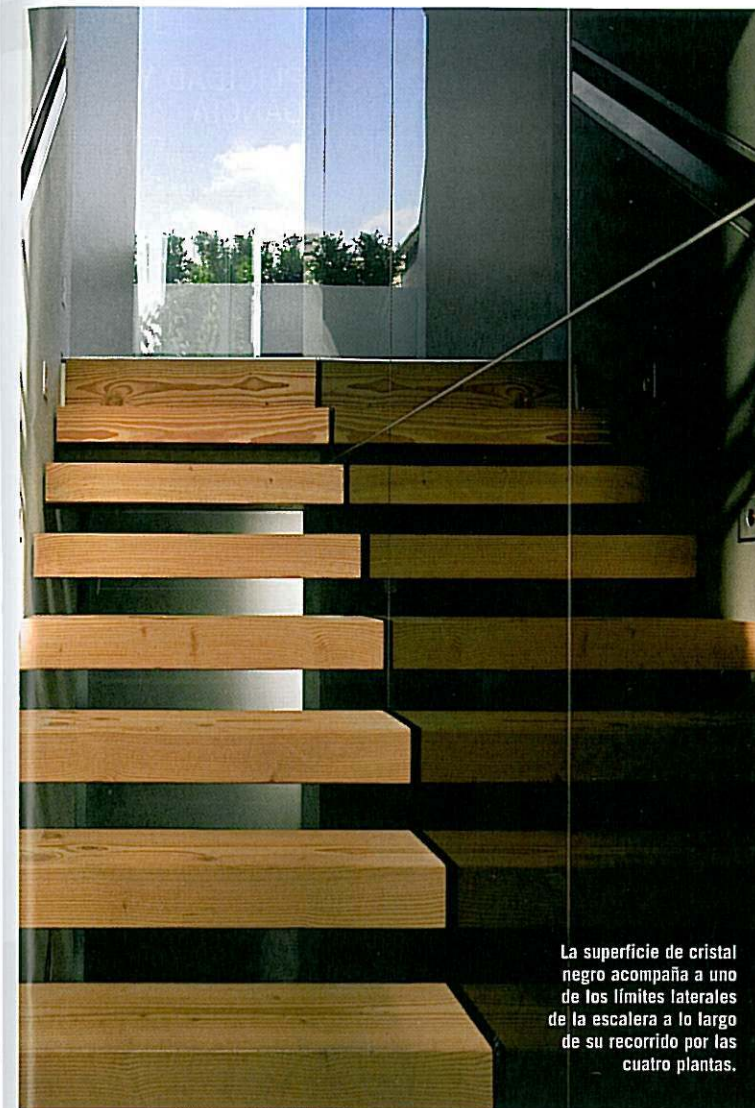
La superficie de cristal negro acompaña a uno de los límites laterales de la escalera a lo largo de su recorrido por las cuatro plantas.

día o la noche. Mews 03 recibe mucha luz solar durante las tardes dada su orientación; por ello, se optó por dejar entrar cuanto luz fuera posible. Sin dejar de controlar el registro desde fuera, para no sobreexponer los interiores. Según Martín, “es importante maximizar la luz, y esa es la razón por la que buena parte de los muros son blancos, para que pueda haber un rebote de la luz alrededor”. Estas superficies claras complementan la pared enchapada en madera Douglas Fir –una especie de pino–, presente en todas las habitaciones, para generar la sensación de estar en una especie de granero de finos acabados. Martín revela que los materiales jugaron un rol visual fuerte para la comprensión de los espacios; las superficies negras reflejantes que corren como una banda vertical, desde el sótano hasta último piso, definen la circulación y contribuyen a ampliar y maximizar las proporciones estrechas de la escalera.