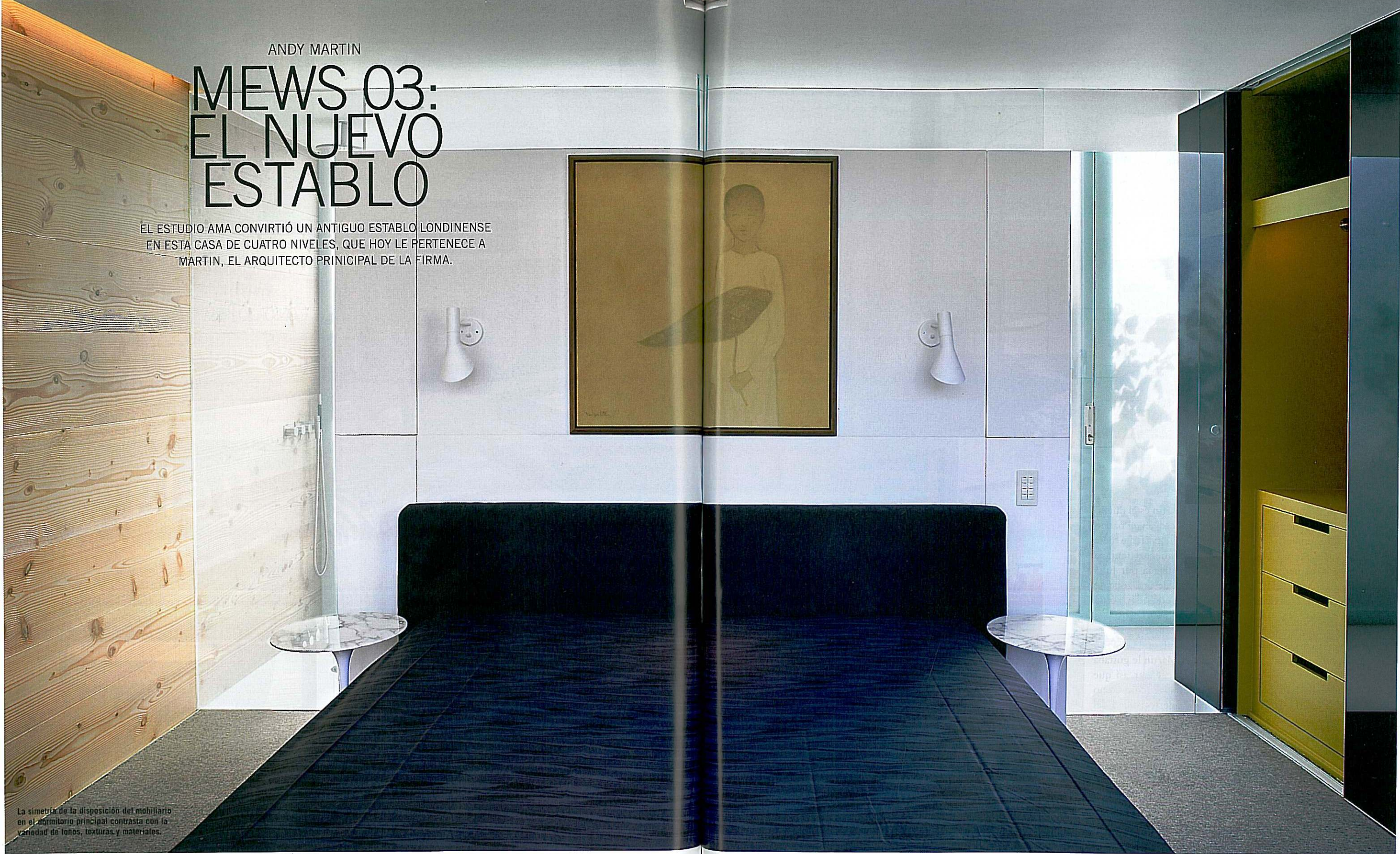
La simetría de la disposición del mobiliario en el dormitorio principal contrasta con la variedad de tonos, texturas y materiales.